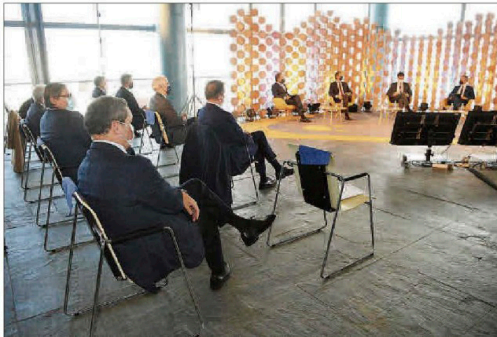
Asistentes al foro celebrado ayer en Pallexco.

"Tenemos una oportunidad histórica de convertir la transformación hacia el vehículo eléctrico en un proyecto tractor que va a reforzar el ecosistema de automoción en todo el país y especialmente en Galicia, que cuenta con un clúster de automoción que agrupa a todo el sector, al fabricante PSA Peugeot Citroën, a más de 120 empresas de componentes y servicios de apoyo y al Centro Tecnológico de Automoción de Galicia", enumeró la ministra.