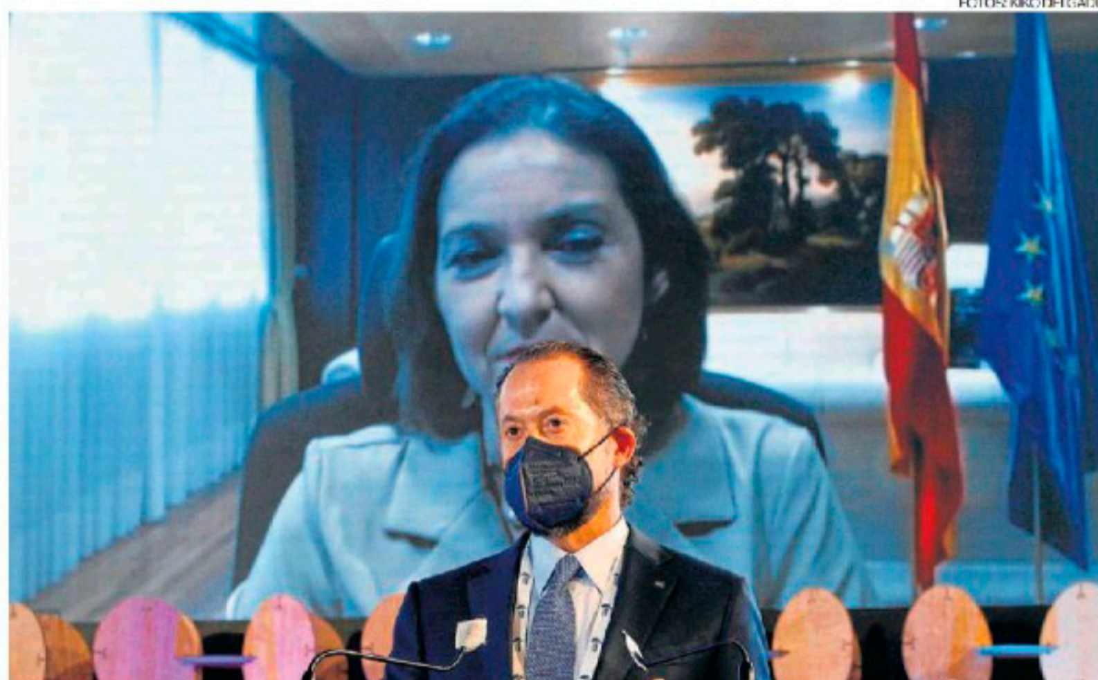
El presidente de Abanca, Juan Carlos Escotet, durante la videoconferencia con la ministra Reyes Maroto.

Por su parte, el presidente de Asime, Justo Sierra, recordó que la anterior crisis no supuso un gran cambio estructural del sistema productivo, mientras que la actual del covid está provocando transformaciones muy profundas en la sociedad. "No es tiempo solo de resistir sino de reinventarse y preparar el futuro", afirmó.