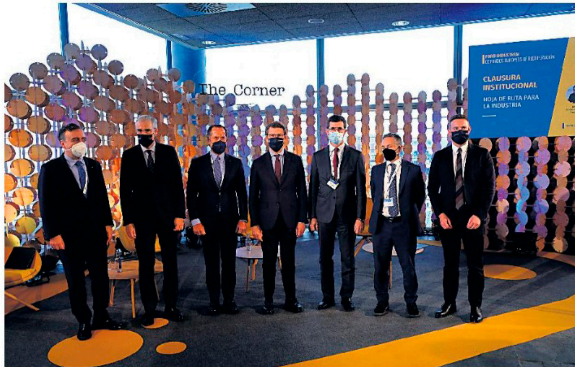
FORO. El presidente Alberto Núñez Feijóo (c), y el presidente de Abanca, Carlos Escotet (3i), entre otros, posan para la foto de familia durante el Primer Foro Industrial de Fondos Europeos de Recuperación, celebrado en A Coruña.

La titular de Industria dijo en su intervención a los representantes políticos y empresariales que este "es el momento de que lideréis la industria del siglo XXI" y trasladó el compromiso "con la reindustrialización de España pero, si cabemás, con la reindustrialización en Galicia".