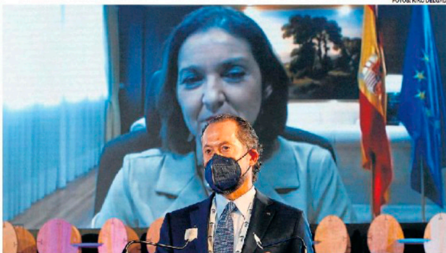
El presidente de Abanca, Juan Carlos Escotet, durante la videoconferencia con la ministra Reyes Maroto.

Por su parte, el presidente de Asime, Justo Sierra, recordó que la anterior crisis no supuso un gran cambio estructural del sistema productivo, mientras que la actual del covid está provocando transformaciones muy profundas en la sociedad. "No es tiempo solo de resistir sino de reinventarse y preparar el futuro", afirmó.