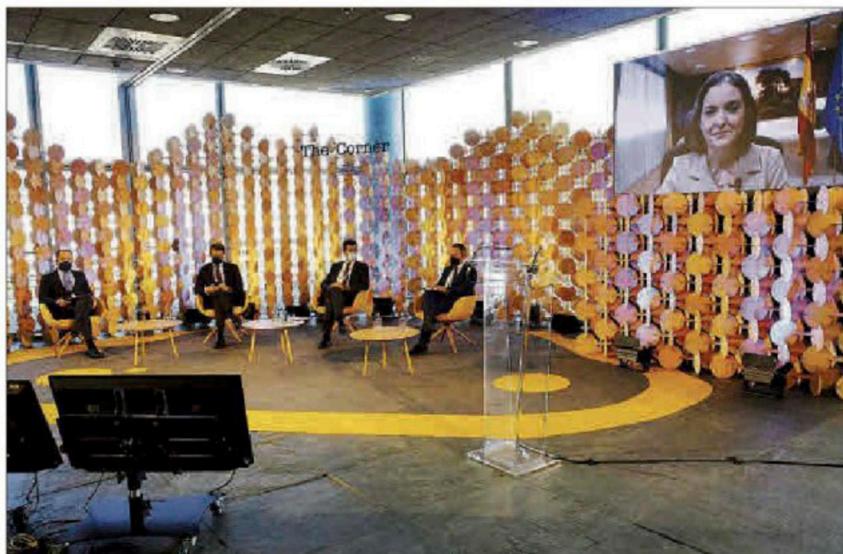
El primer Foro Industrial de Fondos Europeos de Recuperación que se celebró en A Coruña.

La mayoría de las 14 intervenciones coincidieron en que para conseguir los fondos va a ser necesario que se produzca una estrecha colaboración público-privada. Y también estuvieron de acuerdo en que aún hay muchas incógnitas e incertidumbres sobre los fondos