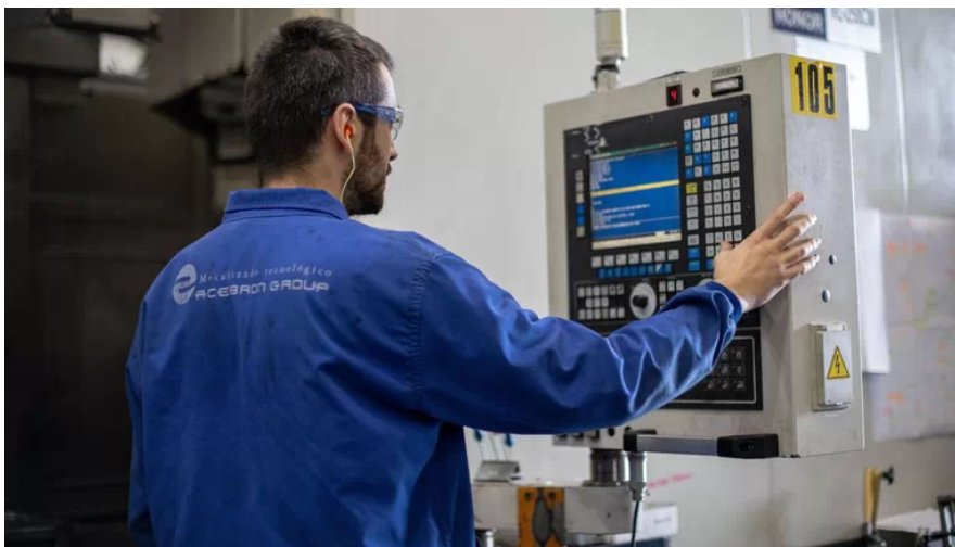
Un trabajador del grupo pontés

El grupo nutre además de componentes y servicios a compañías de los sectores energéticos, naval y del metal en España y a nivel internacional